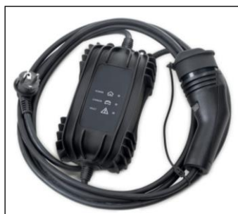
Štandardný kábel pre zapojenie do domácej 230V zásuvky 98 505 251 80