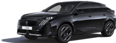
Čierna PERLA NERA