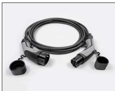
Kábel režimu 3 pre pripojenie do nabíjacej stanice (domáceho WallBoxu alebo verejnej stanice)