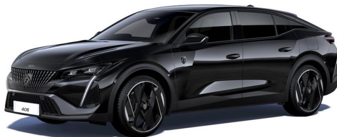
Čierna PERLA NERA